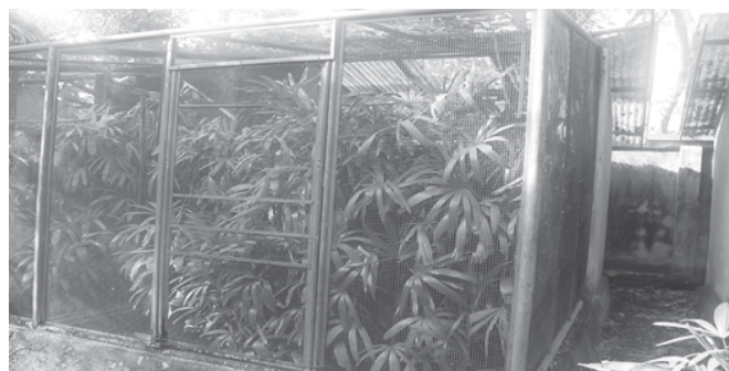
Gambar 1. Relung I dari burung jalak bali di Bali Bird Park.

Masing-masing relung burung yang diteliti memiliki ciri khas tersendiri (Gambar 1). Pada relung I ditumbuhi oleh 1 jenis tumbuhan yang berasosiasi dengan burung jalak bali yaitu palem wregu ( Rhapis excelsa ). Di dalamnya juga terdapat sarang berbentuk kotak ( nest box ) dan terdapat sebatang kayu kopi untuk tempat bertengger. Relung ini ditempati oleh satu pasang burung jalak bali. Pada penelitian ini digunakan 2 pasang burung dengan kondisi relung yang sama dengan letak berdampingan. Kondisi relung ini dibuat agar burung tersebut dapat melakukan aktifitas breeding tanpa ada gangguan.