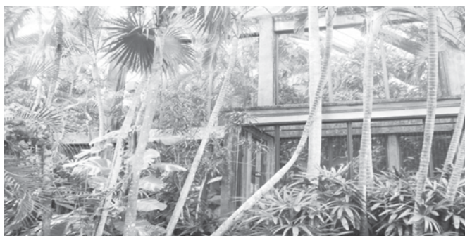
Gambar 2. Relung II dari burung jalak bali di Bali Bird Park.

Pada relung II (Gambar 2) ditumbuhi oleh berbagai jenis tumbuhan antara lain palem wregu ( Rhapis excelsa ), palem kipas ( Livistona rufundifolia ), palem kol ( Licuala grandis ), beringin ( Ficus benjamina ), bunut ( Ficus glabera ), bambu ( Bambusa sp.), flamboyan ( Delonix regia ) dan pada bagian bawah relung ditumbuhi oleh berbagai jenis rumput. Pada relung ini juga dilewati oleh sungai buatan. Di dalam relung ini terdapat 10 pasang burung jalak bali dan burung lain yang berasosiasi seperti kuntul kerbau ( Bubulcus ibis ), tekukur biasa ( Streptopelia chinensis ), merbah cerucuk ( Pycnonotus goiaveir ), betet jawa ( Psittacula alexandri ), jalak suren ( Sturnus contra ), kepodang kuduk hitam ( Oriolus chinensis ), perkutut ( Geopelia striata ) dan jalak kerbau ( Acridotheres javanicus ).